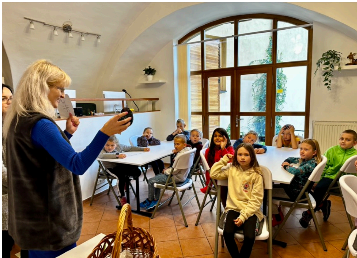
Učebnu jsme pojmenovali Inspirium - laboratoř vzdělávání, a zveme do ní školy (nahore) děti, co se učí angličtinu s rodilou mluvčí...