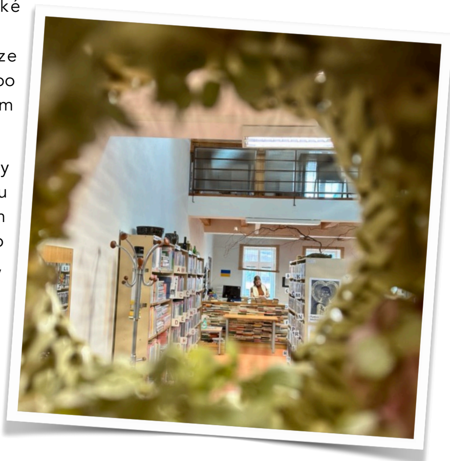
Revize v Trnávce.

V roce 2023 byly revidovány knihovny v Boršově, Městečku Trnávce, Vranové Lhotě, Starém Městě a Třebařově, uskutečnilo se 23 metodických návštěv, 8 konzultací a bylo vytvořeno 79 výměnných souborů o celkovém počtu 5130 knih. Dalších 278 knih bylo půjčeno prostřednictvím meziknihovní výpůjční služby.