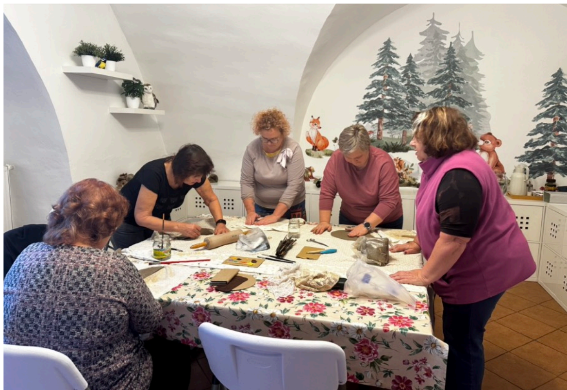
...dospěláky na tvoření v rámci Kreativních úterků (nahore) a nebo třeba seniory na vzdělávání či vánoční besídku VU3V.