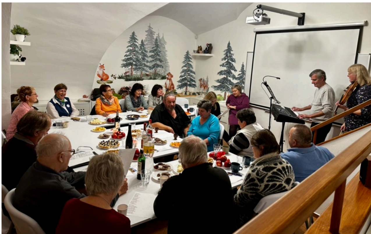
V VU3V se sešla skvělá parta, která se rozhodla zakončit první semestr vánočním večírkem.

Uspořádali jsme tři školení pro seniory „Jak na chytrý telefon a tablet“. Zájem byl tak velký, že další dvě jsou plánována na rok 2024.