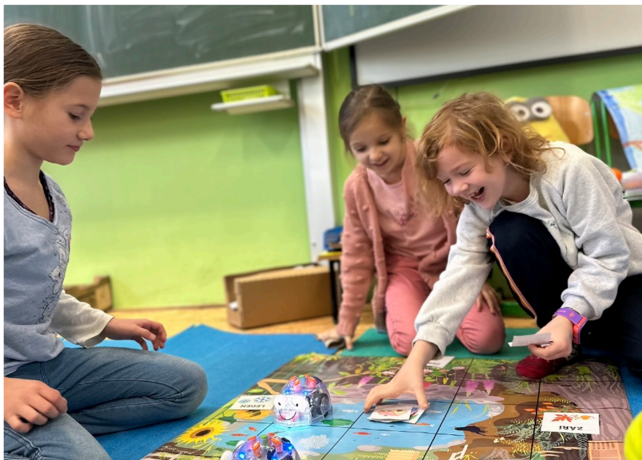
S robotickými leklemi jsme navštívili všechny třídy prvního stupně

Uspořádali jsme 442 akcí pro veřejnost (a dalších 16 jich uskutečnila pobočka v Boršově), kterých se zúčastnilo 11.333 návštěvníků (z toho 231 v boršovské pobočce), což je o 1784 víc než v loňském, dosud nejúspěšnějším roce.