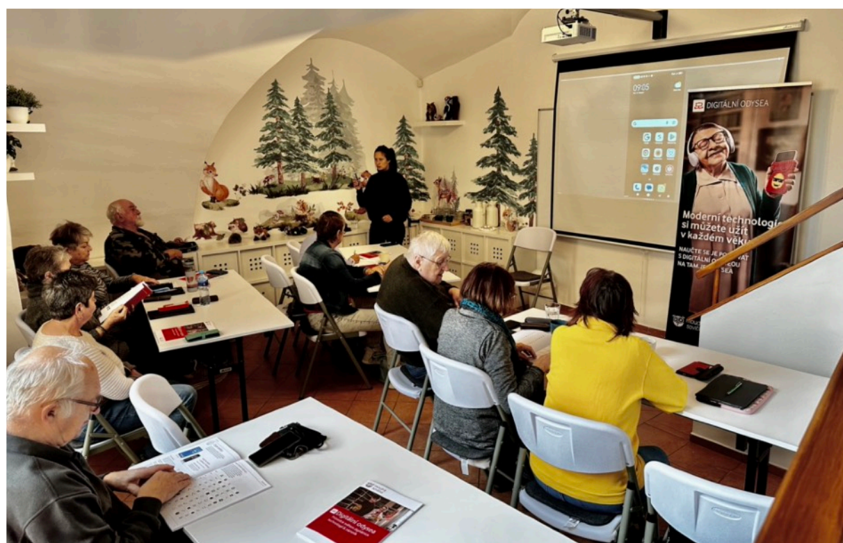
Snímek z jednoho z několika školení pro seniory „Jak na chytrý telefon a tablet“