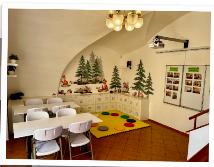
Studovna před proměnou a po ní.

A tak jsme vymalovali studovnu, přilehlou kancelář, toaletu a sklad, vyměnili koberec ve velké kanceláři. Nechali jsme vyrobit regály na kolečkách pro region, který dosud sídlil v přeměňované části knihovny a který jsme nyní přestěhovali do společné kanceláře. Většinu nábytku ze studovny jsme za pomoci studentů vojenské školy přesunuli do pobočky v Boršově, která tím získala na útulnosti.